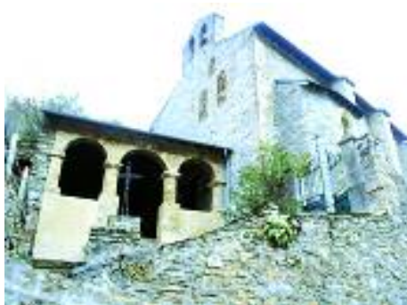
L'église de Campagna de Sault

- Si moins des 2/3 des communes acceptent le retrait, elle peut faire appel au Préfet qui peut trancher en sa faveur.