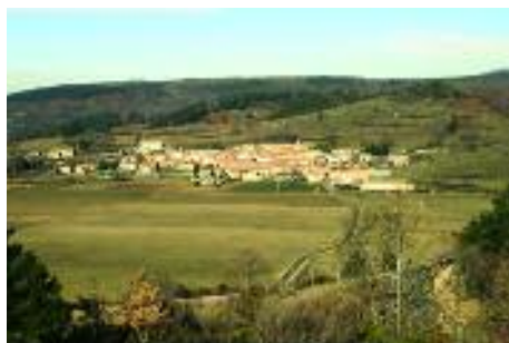
Le village d' Aunat

“ La décision finale appartient au Conseil Communautaire qui doit délibérer favorablement pour qu'une action soit réalisée. ”