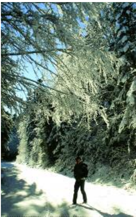
Balade hivernale dans les forêts du Pays de Sault