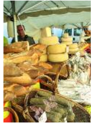
Produits du terroir