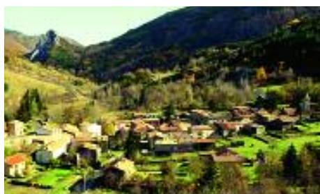
Joucou en automne