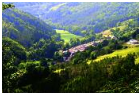
Belfort sur Rébenty

Le contrat de développement et d'aménagement est un plan d'action pluriannuel permettant de mettre en œuvre le projet de territoire et planifiant l'engagement financier du Conseil Général pour trois ans renouvelable deux fois.