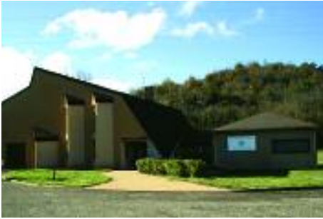
La Maison de la Montagne