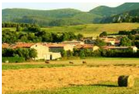
Espezel en été