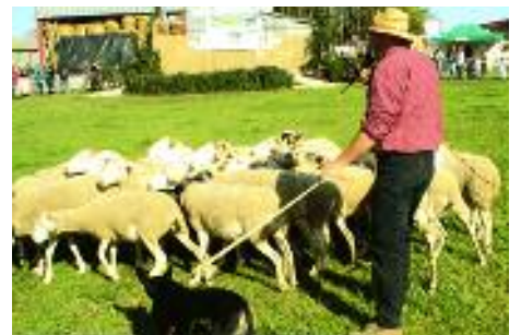
Foire d'Espezel, démonstration de chiens de berger.