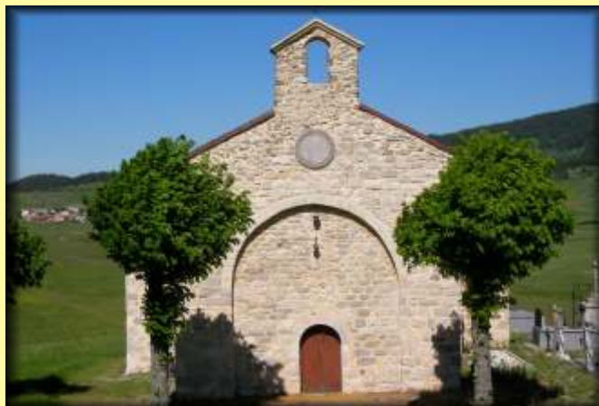
Eglise Notre Dame de Montaillou ou "Chapelle de la Vierge"

Suivez cet itinéraire jusqu'au col de Balaguès. Au Col prenez à gauche et suivez la ligne de crête jusqu'à la station de ski de Camurac. Au Col du Teil, prenez à gauche, sans descendre, le long des chalets. Au croisement avec les parkings de la station, prenez un peu sur la droite et en face, le chemin de terre ( P2). Suivez ce chemin jusqu'au dessus des pistes de ski. A l'embranchement, prenez le chemin de gauche descendant et suivez le jusqu'à son début dans la forêt. Là, prenez le sentier qui part à droite, et suivez le jusqu'à la route goudronnée de la station que vous traversez. Prenez le chemin sous-bois qui descend. Au premier embranchement prenez sur la gauche, puis suivez jusqu'au large chemin que vous prendrez sur la gauche, longeant le camping. A hauteur d'un bâtiment en retrait du chemin, prenez le sentier sur la gauche, et lorsque vous êtes de nouveau sur le large chemin, à hauteur d'une barrière, prenez sur la gauche et de suite le sentier qui descend sur la droite. En bas de ce sentier, vous traversez la prairie et prenez la route sur la gauche jusqu'au village.