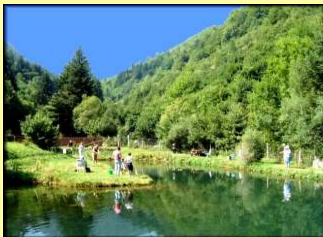
Pisciculture de LAFAJOLLE

Arrivés sur la route forestière, prenez à droite et suivez là jusqu'au croisement sur un petit court d'eau : le ruisseau de "Font d'argens". Descendez la route forestière sur votre droite jusqu'à la D 107. Prenez à droite (descente) sur environ 400 mètres. Au panneau annonçant la pisciculture, descendez le chemin sur votre gauche. Après le pont sur le Rebenty, prenez à droite l'ancien chemin de Lafajolle. Suivez ce chemin jusqu'au village sans prendre les embranchements qui se présentent à gauche. En arrivant dans la petite rue, on remarquera l'ancien four à pain dans le mur de la maison de droite.