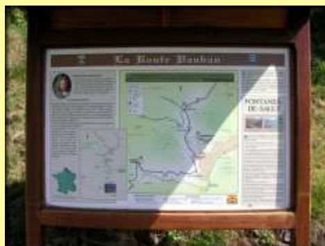
Panneau présentation route Vauban