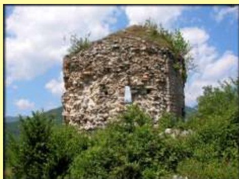
Ruine de l'église du Pech

Tout au long de votre trajet retour vous pourrez admirer la profonde vallée de l'Aude avec en fond de paysage, une belle vue sur le château d'Usson.