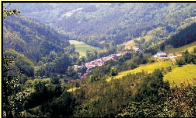
Le village de Belfort sur Rébenty, avec, sur sa gauche la forêt communale de la Seillette.

(Suite) Arrivé sur un large chemin, prendre à droite. Au croisement avec le GR7, reprendre en direction de Belfort sur Rébenty par le chemin emprunté à l'aller.