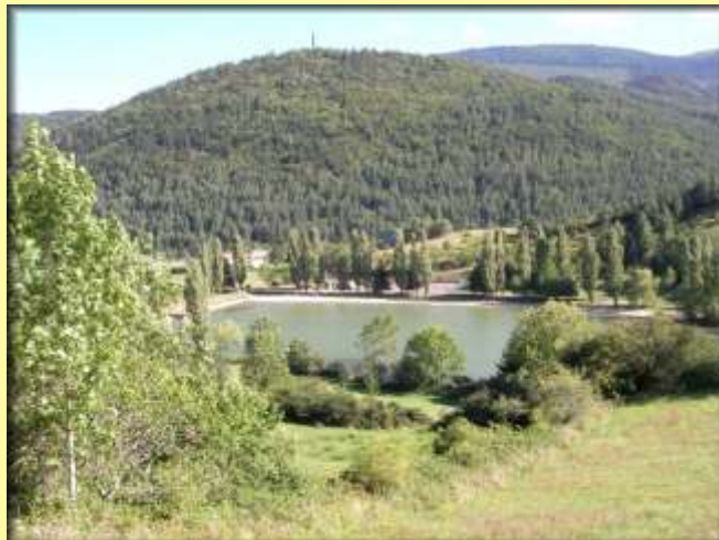
Belcaire, le lac, le sommet du Bouichet

Sinon vous continuez sur le chemin descendant jusqu'au panneau B5 ou vous tournez à droite. Les croisements suivants prenez à droite pour arriver en haut de Belcaire, rue de l'Oum que vous descendez pour rejoindre votre point de départ.