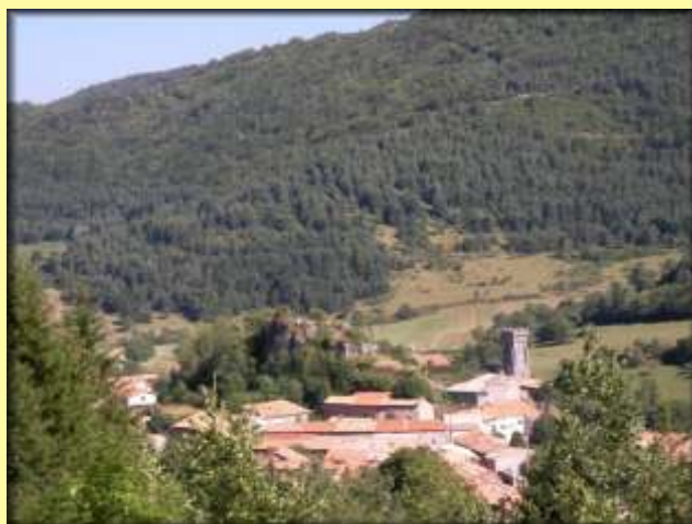
Clocher et emplacement ancien château de Belcaire

Arrivés au Col prenez le chemin de droite qui descend vers Belcaire avec une vue sur le lac et le camping. Au panneau A5 prenez la rue goudronnée sur la gauche qui vous mène sur l'avenue d'Ax les thermes que vous traversez. En face prenez la petite rue sur votre gauche, jusqu'à la vieille fontaine et son bassin que vous contournez à gauche pour revenir sur l'avenue d'Ax les thermes que vous descendez jusqu'à votre point de départ 200 mètres plus bas.